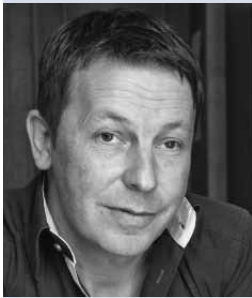
Daniel Häni Der Unternehmer plädiert für eine Schweiz mit bedingungslosem Grundeinkommen für alle. 6